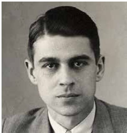
WALRAVEN VAN HALL

cursus 7938 zondag 7 april 2019, 11:00-13:00 uur, kosten: € 17,50