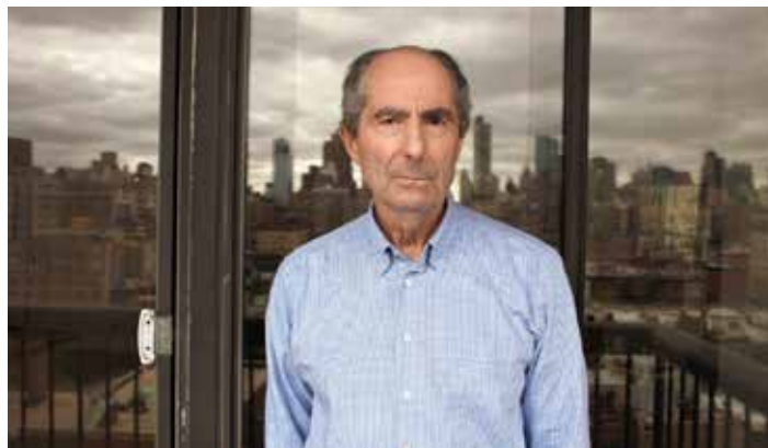
PHILIP ROTH