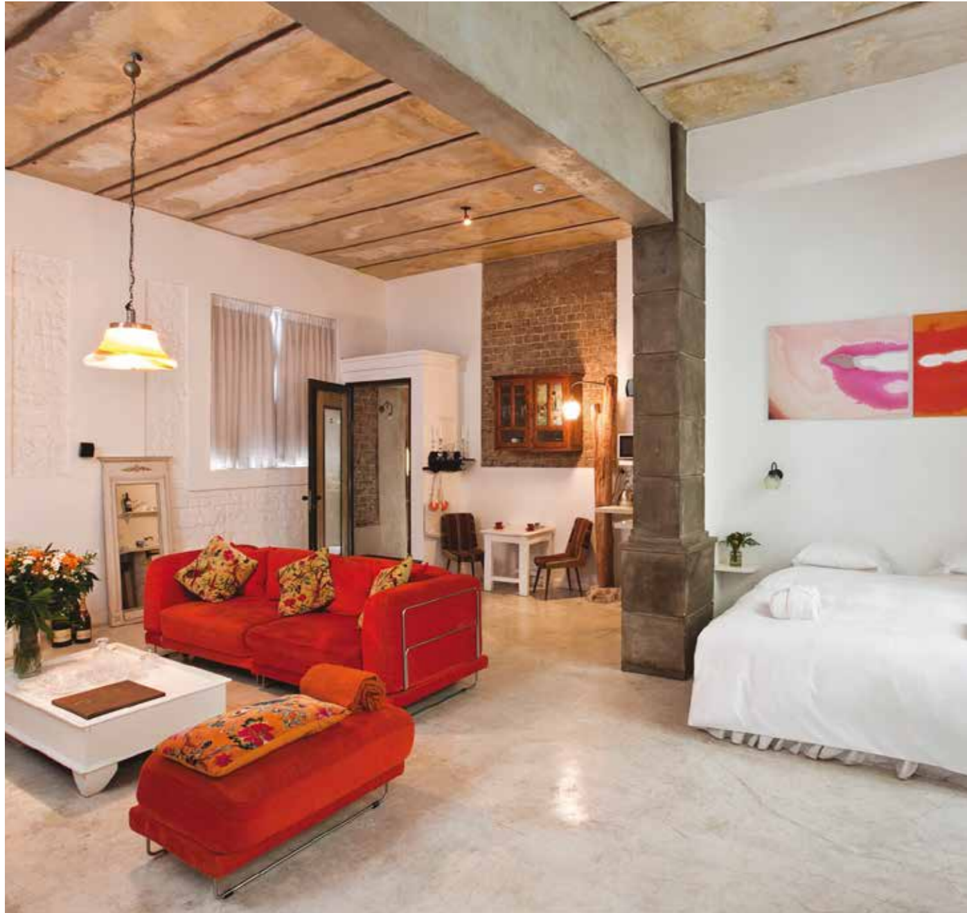
Boetiekhôtel Neve Tzedek, Degania Street 4, Tel Aviv. Tel: 054-207 07 06 www.nevetzedekhotel.com

In het hart van het schilderachtige Neve Tzedek vind je het boetiekhôtel met dezelfde naam. Het hotel heeft een prachtig interieur, een badkamer die je thuis ook wil hebben, en heel veel verse bloemen.