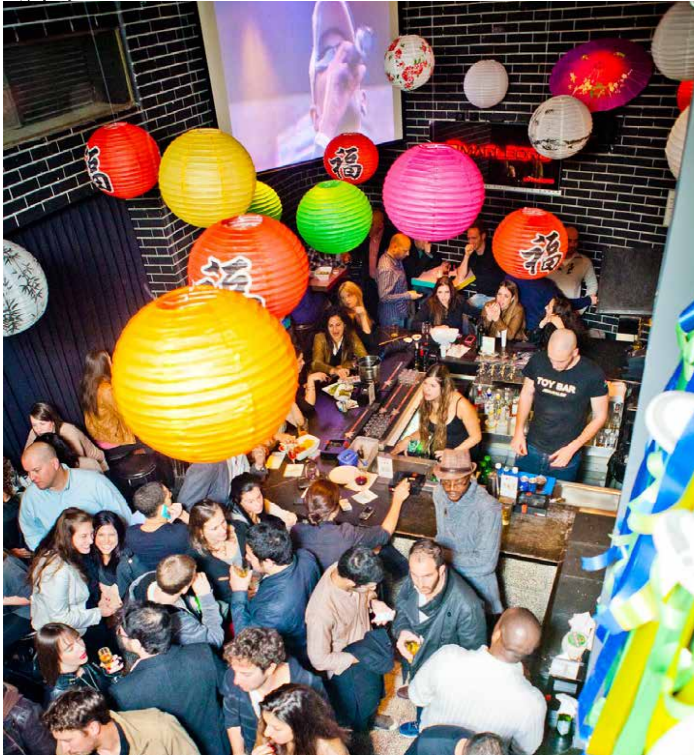
Bar Hatzatzua (Speelgoed), Dhu Nuwas Street 6, Jeruzalem. Tel: 02-623 66 66 www.thetoybar.com