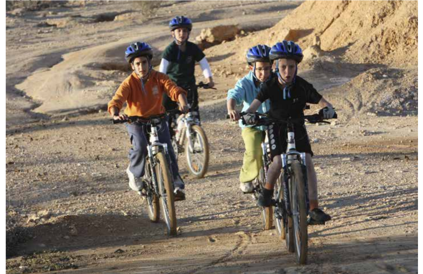
Yeruham, Atid Bamidbar 08-658 54 84 of 050-722 70 62 www.bamidbar.org