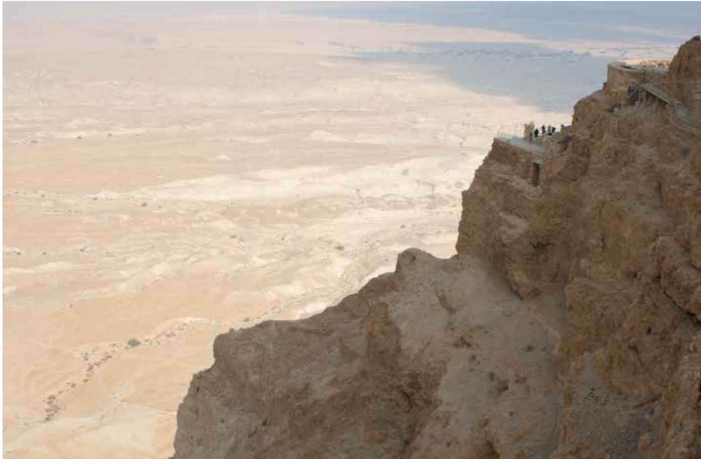
Masada, langs snelweg 90.

Een absolute must. Niet alleen vanwege de unieke geschiedenis van dit fort in de woestijn, maar ook om de fenomenale uitzichten over de Judeawoestijn en de rode bergen van Jordanië. Masada ligt op een enorme rots midden in de woestijn aan de rand van een opgedroogd gedeelte van de Dode Zee. Het ligt ten zuiden van Ein Gedi. Aan Masada is een boeiende geschiedenis verbonden. Ooit was het een buitenpaleis van koning Herodes. Toen in het jaar 70 van de gewone jaartelling Jeruzalem werd verwoest, bezette een groep fanatieke Joden Masada: een vrijwel onneembare vesting. De groep kon zich hier verschansen omdat Masada beschikte over enorme cistrens waarin water dat 's winters uit de bergen kwam, kon worden opgeslagen. Uiteindelijk, na een lange belegering, legden de Romeinen een soort ram aan en werd Masada ingenomen. Maar de bewoners weigerden zich over te geven, ze pleegden voor de inname collectief zelfmoord. Vanaf de vesting heb je niet alleen een fantastisch uitzicht, maar ook kun je nog precies de resten van de kampe-menten van de Romeinen zien liggen.