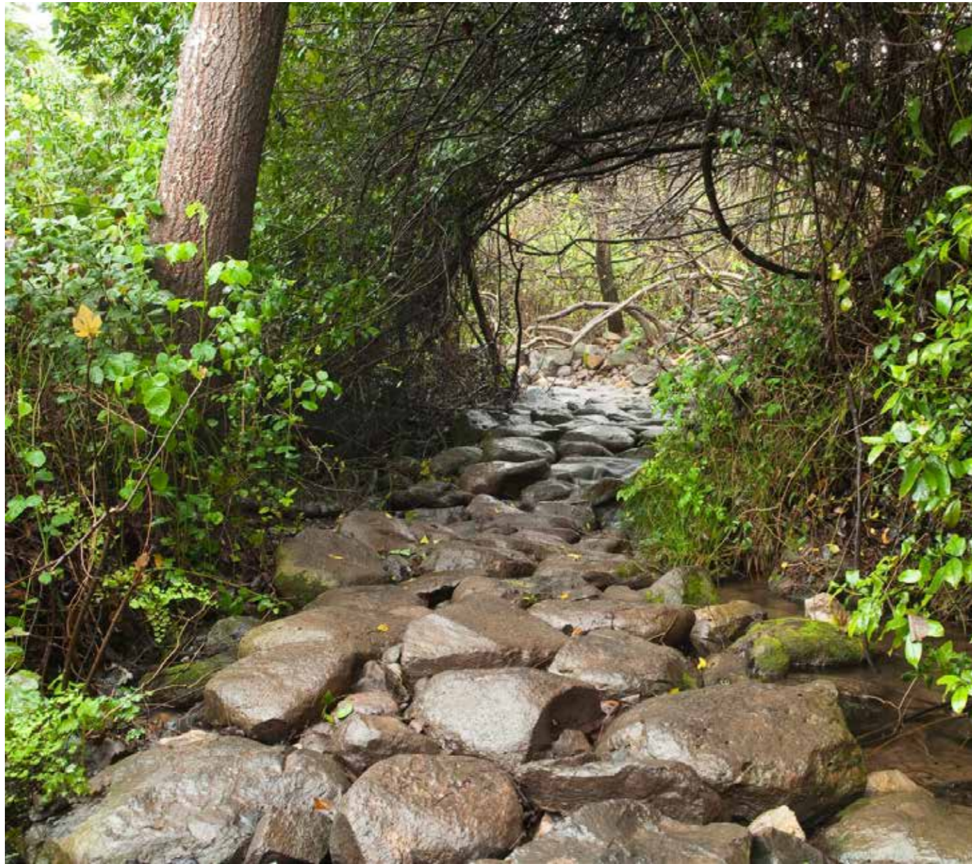
Tel Dan, langs route 99, ten noorden van Kiryat Shmona. Tel: 04-695 02 18

Het nationale park Tel Dan is een prachtcombinatie van archeologie en natuur. De flora in dit deel van Israël is overdadig vanwege de aanwezigheid van water dat afkomstig is van de Golan Hoogvlakte en de Hermonberg. Ooit was Dan de noordelijke hoofdstad van het rijk. Sinds de jaren 90 hebben er belangrijke opgravingen in dit deel van het land plaatsgevonden. Niet alleen vonden archeologen bijzondere bogen en andere artefacten op deze plek, ook vonden ze de Tel Dan Stèle uit de 9 e eeuw voor de gewone jaartelling waarop voor het eerst de naam van het 'Huis van David' voorkomt. Je vindt de stèle in het Israel Museum in Jeruzalem, zie het hoofdstuk musea. Nog steeds vinden in dit gebied opgravingen plaats, maar ben je niet dol op oude stenen, dan heeft de rivier de Dan ook nog de prachtigste natuur te bieden, voor jong en oud. Huur een mountainbike of volg één van de wandelroutes die je voor een deel dóór de rivier leidt. Bezoekers noemen dit vaak de groene jungle van Israël.