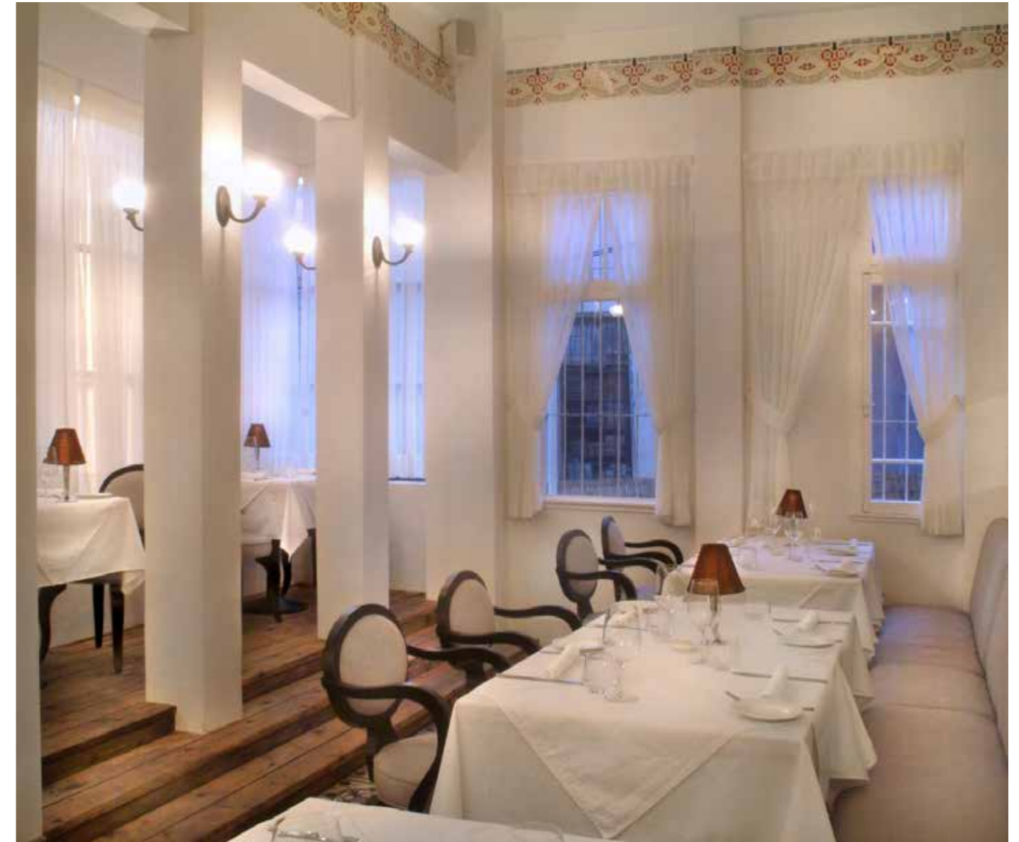
Catit, Heichal Talmud Street 4, Neve Tzedek Tel Aviv. Tel: 03-510 70 01 Facebook: http://www.facebook.com/catit.tlv