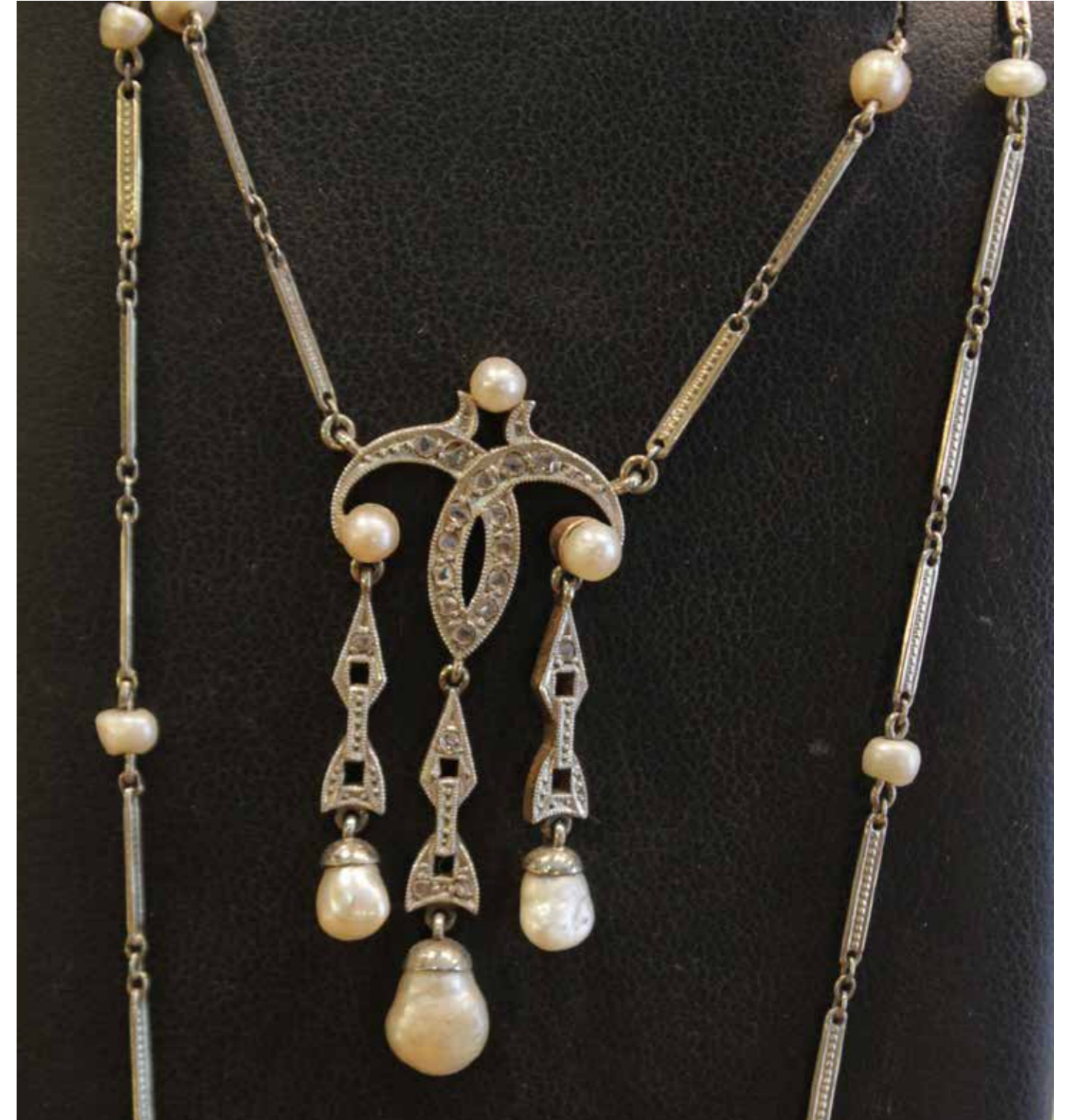
Ophir, Yaffo Road 38, Jeruzalem. Tel: 02-624 90 78 www.ophir-jewelry.com

Een bijzondere winkel voor handgemaakte en antieke sieraden. Van Victoriaans, Edwardiaans en Art Deco tot stijlen uit het Midden-Oosten. Dit is een heerlijke winkel om gewoon rond te snuffelen en zomaar een paar mooie antieke oorbellen te zoeken.